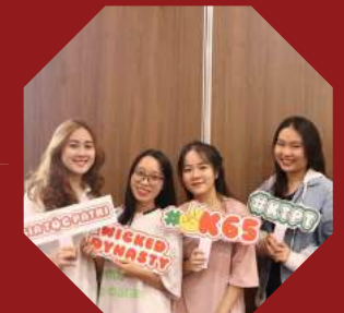
Chào tân sinh viên khoa