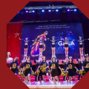
Gala chào tân sinh viên

“Hơn cả việc giúp đỡ nhau bước qua những ngày mới lên đại học đầy ngỡ ngàng, Buddy System là sợi dây ‘lịch sử’ buộc những người anh em UEB lại, tạo nên một khối UEB độc nhất.”