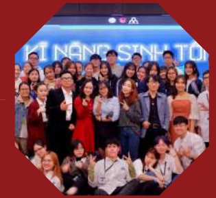
Workshop Kỹ năng sống